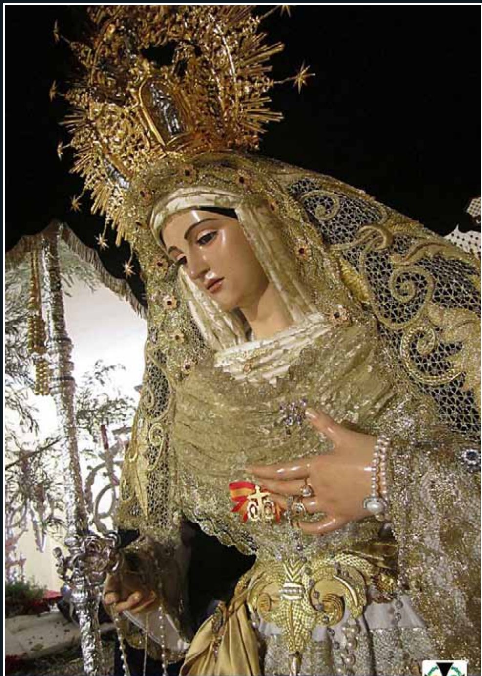
● MARÍA SANTÍSIMA DE LA VICTORIA ●