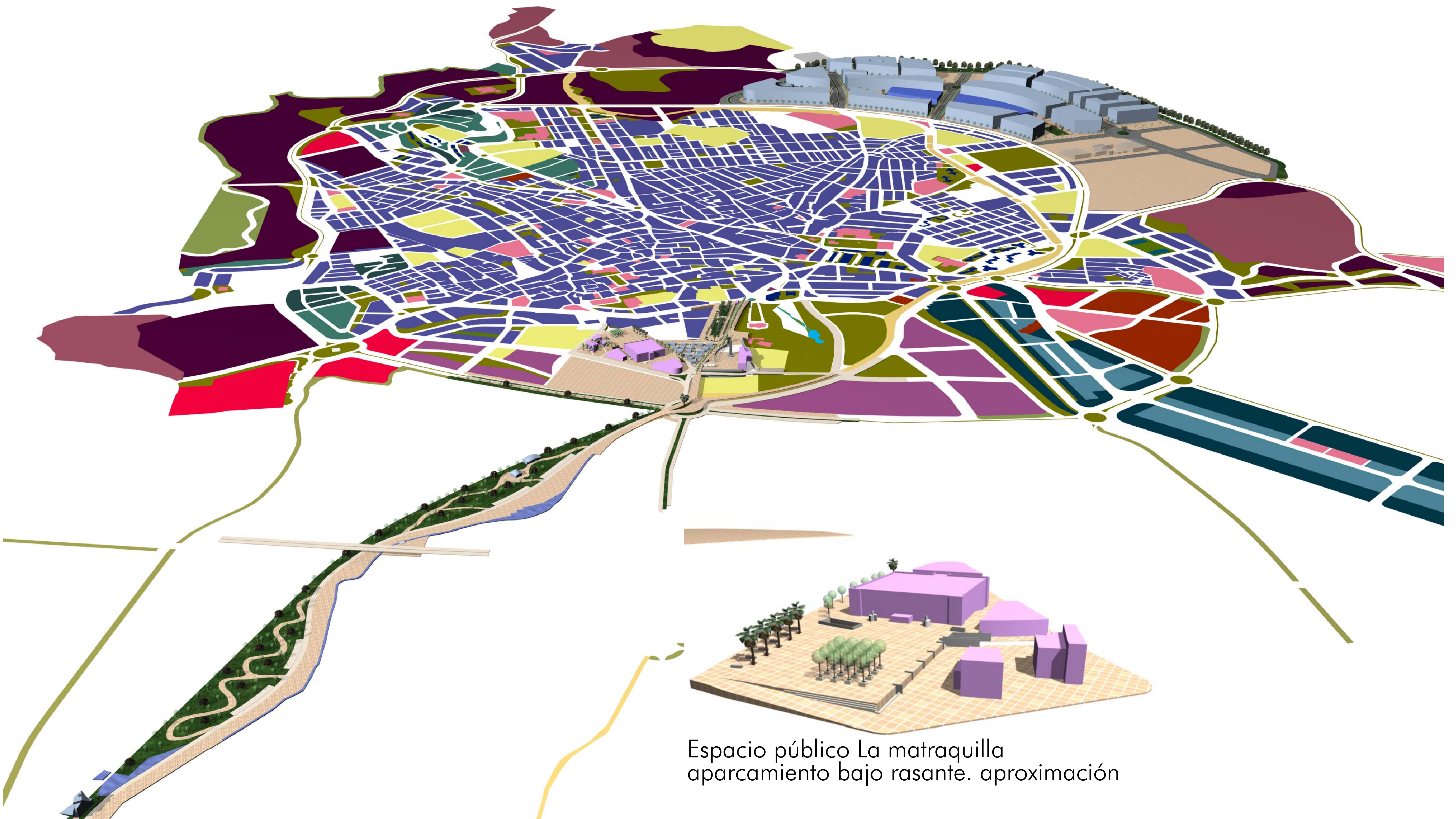
Espacio público La matraquilla aparcamiento bajo rasante. aproximación