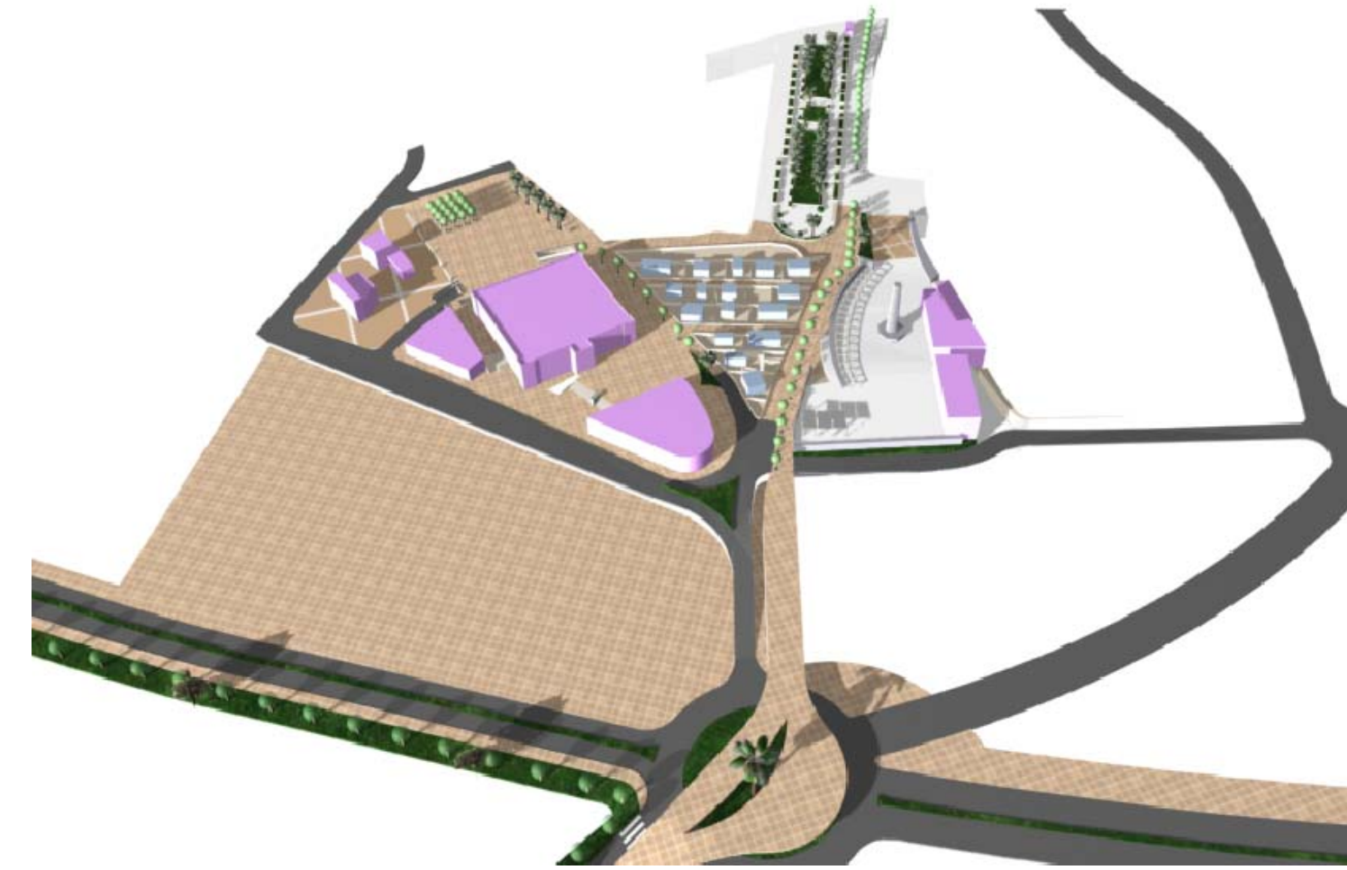
Aproximación: espacio público La matraquilla