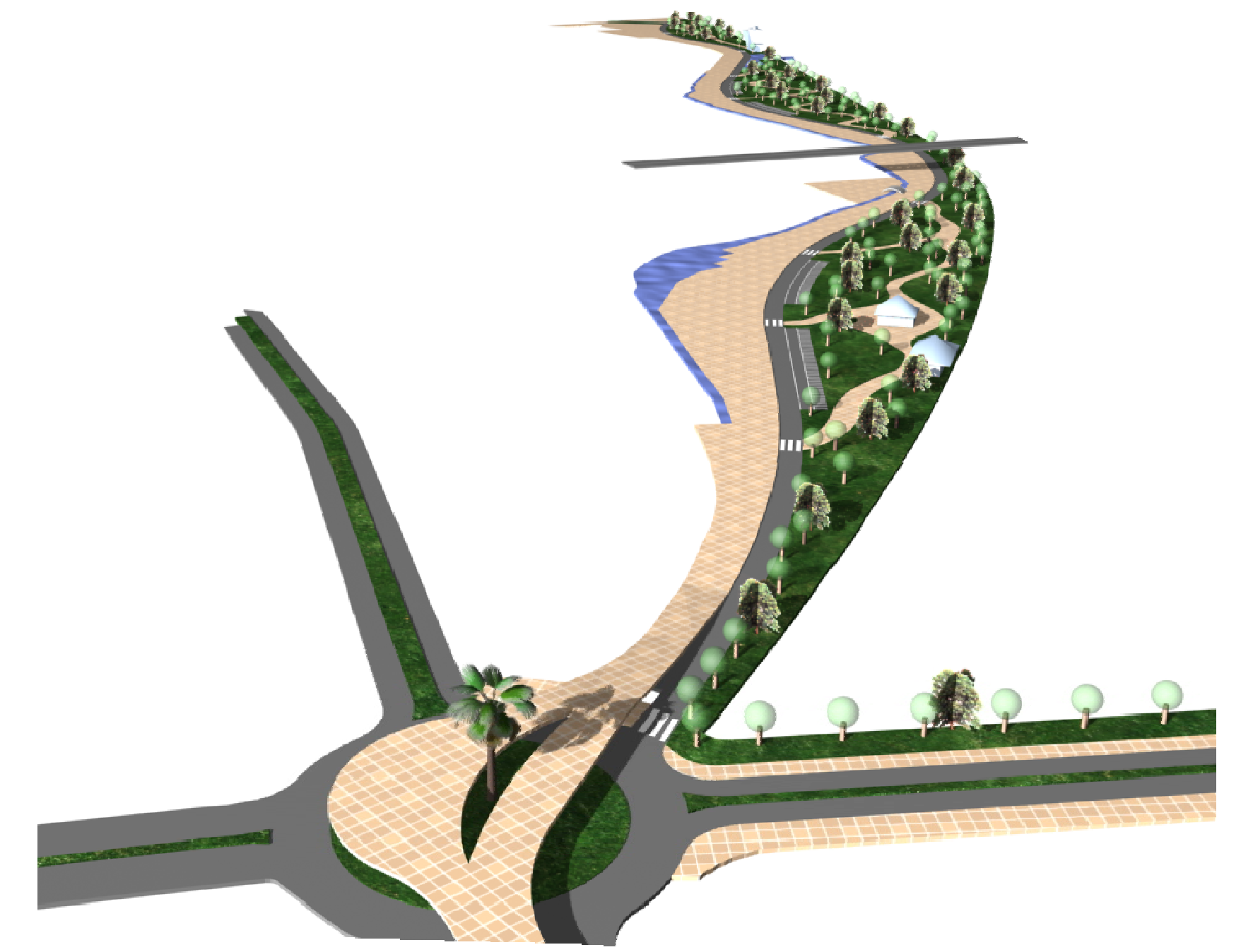
Imagen: Aproximación de Ronda sur y vista de Vía parque hacia la playa.